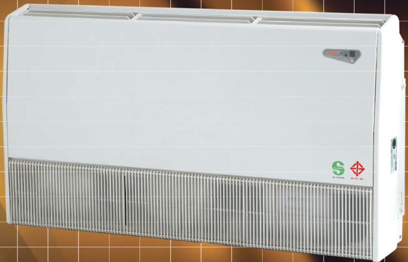
Floor Standing Type

Golden Series OF COOLING SYSTEM PERFECTION