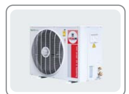
CONDENSING MODEL : CCS-32EFN